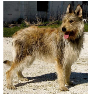
Bouvier des Ardennes

Der Bouvier des Ardennes ist ein robuster, energiegeladener und intelligenter Arbeitshund. Neugierig, verspielt und anpassungsfähig, zeigt er starke Persönlichkeit und Territorialverhalten. Ein mutiger Beschützer und treuer Begleiter für aktive Menschen.