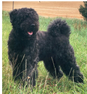
Bouvier des Flandres

Der Bouvier des Flandres ist ein robuster, intelligenter und treuer belgischer Hütehund mit rauem, wetterfestem Fell und markantem Bart. Ruhig und selbstbewusst, eignet er sich als vielseitiger Familien- und Arbeitshund, je nach Zuchtlinie!